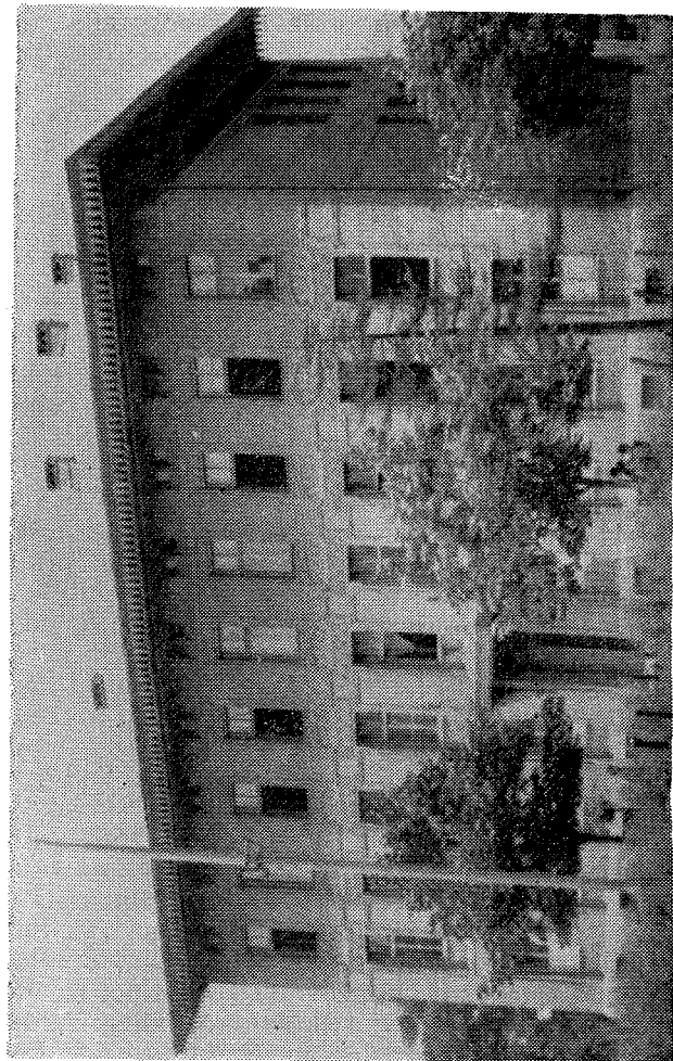
Sadašnja zgrada Gimnazijc (bivša osnovna škola)