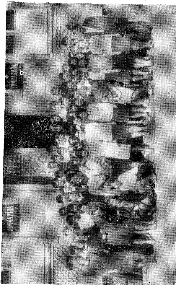
Maturanti iz 1966./67. šk. godine prije pisanja pismenog rada iz srpskohrvatskog jezika (15. 6. 1967. god.)