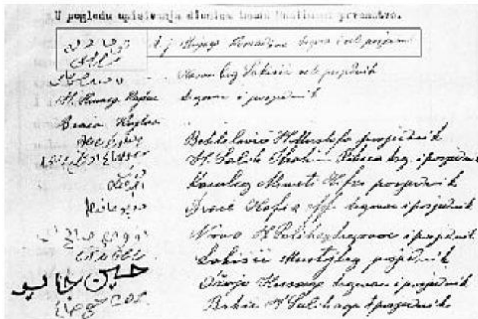
(faksimil zadnje strane “Prospekta” Prvog hercegovačkog muslimanskog trgovačkog udruženja d.d. u Mostaru - Spisak osnivača udruženja ZMF, 2810/BiH/1908.)