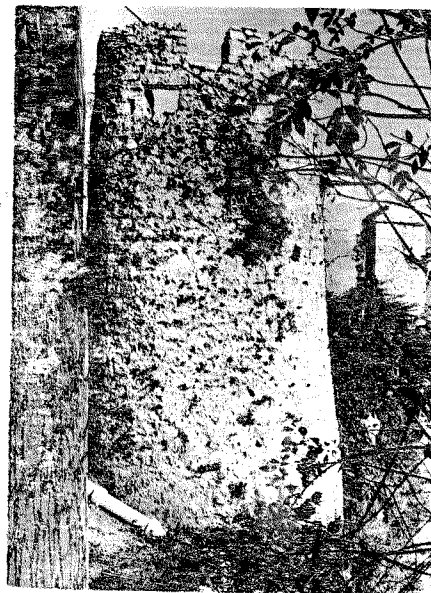
Herceguša — južno pročelje fortifikacije