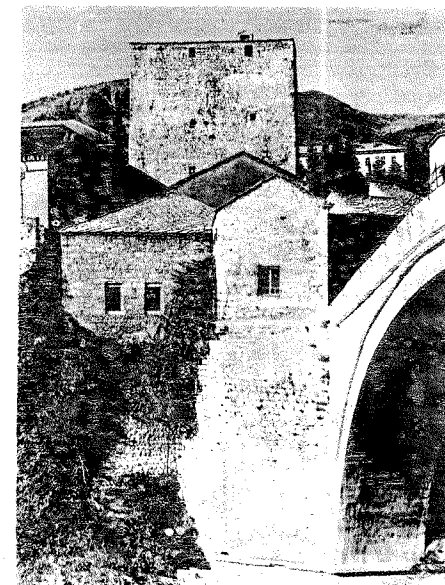
Tvrđavski ansambl — lijeva obala Neretve