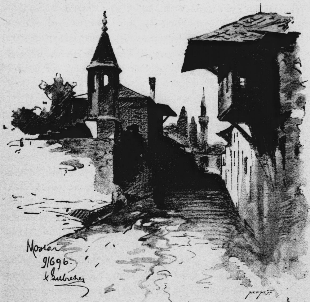
Motiv z Mostaru.

Pravým přepychem přírody slyne čtvrť Zahumlje svými zahradami, jež nejbujnější flóra nádherně vyzdobuje. Od starého mostu sem také nedaleko. Bašča za baščou*) řadí se tu podle sebe, a přes ploty jejich i nízké zdívo rozkládají větve své mohutné smokvoně, stromy morušové i ořechy. Mezi sytou zelení