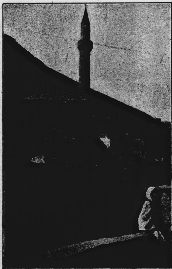
Šarićova džamie v Cernici (Mostar).

kterou ovládá. Zde bylo poslední sídlo samostatných zemských knížat a k tomuto památníku staré slávy domorodých vládců pojí se snad dějinná vzpomínka císaře Konstantina, o hradu Bonu v zemi Chlumské. Jako u všech vynikajících míst na slovanském