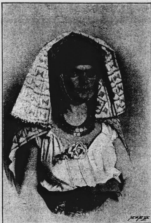
Ženský typ ve střední Hercegovině.

po ruce měli. Stavba dokončena byla r. 1852 a v témž roce předsídlil vikář do Mostaru. Význam tohoto kroku pro katolickou obec mostarskou byl ihned znatelný. Před r. 1852 sídlilo v Mostaru sotva 120 katolických rodin, které náležely k třídě chudých sluhů a řemeslníků, z nichž ani jeden nevládnul sebe menším dučanem