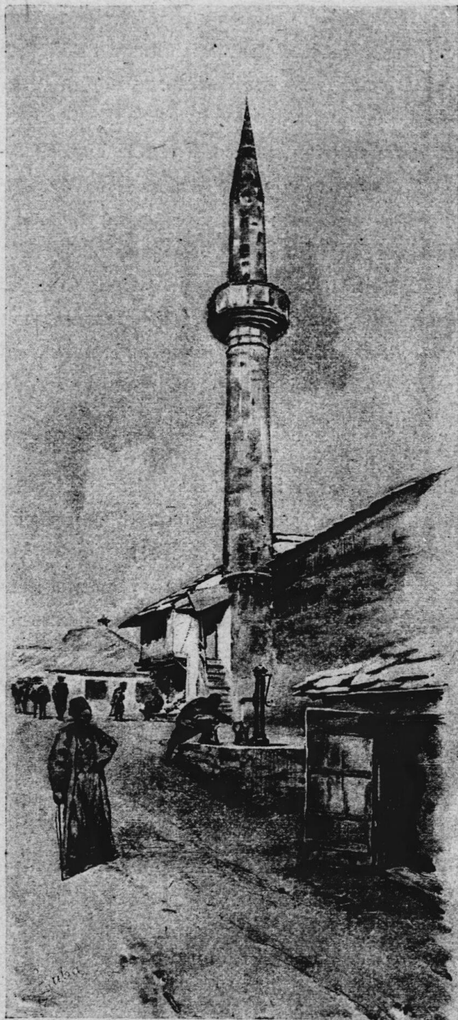
Před čaršii v Mostaru.

Volíme-li výlet jižním směrem, kolem tabákové továrny a ležení barákového, mineme na pokraji rozsáhlého Bišće-polje, podle silnice na Blagaj vedoucí, rozkošně položenou vinařskou a ovocnickou pokusnou stanici zemskou. Ústav tento zaujímá na 40 hektarů osázené půdy a vyniká v každém ohledu moderním zařízením. Mostarské okolí pověstné jest svými výbornými druhy vín, která v poslední době utěšenému vývozu se těší.