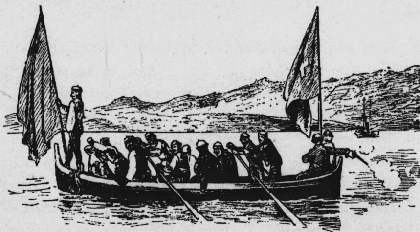
Scena z pobřeží dalmatského.

Z Mostaru podél Neretvy a na Metkoviće dále k břehům Adrie použil jsem vítané společnosti sarajevského spolku pěveckého, jenž podnikal právě výlet do staroslavného Dubrovníku.