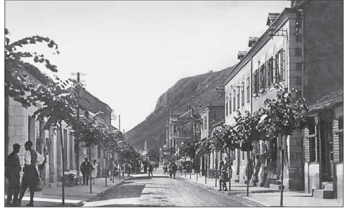
SL. 4. CERNICA (UL. RIZINA) S POČETKA 20. ST.

FIG. 3 RAILWAY STATION SQUARE WITH THE ADMINISTRATIVE DISTRICT BUILDING AND THE RAILWAY STATION