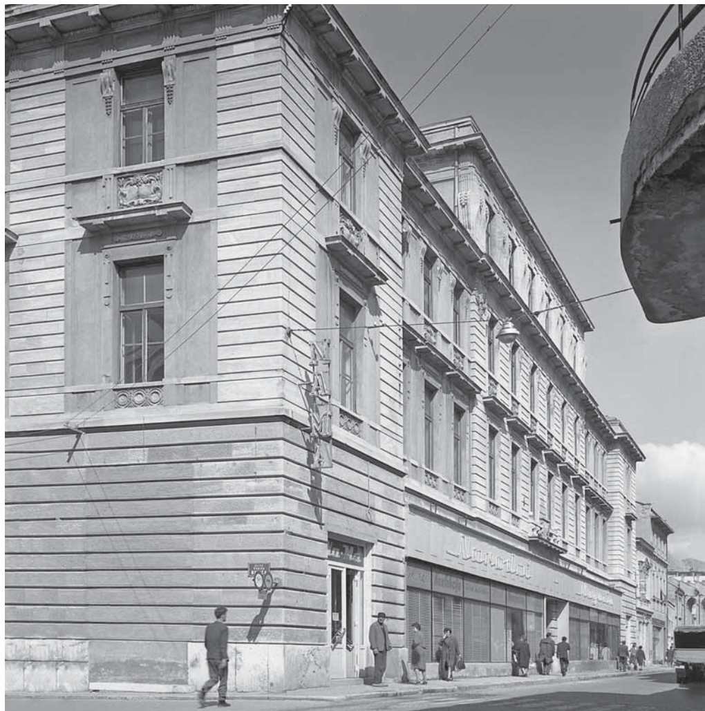
SL. 1. ZGRADA VOJNIH KOMANDI NA GLAVNOJ ULICI, AUTOR: JOSIP PL. VANCAS FIG. 1 MILITARY HEADQUARTERS BUILDING ON MAIN STREET, AUTHOR: JOSIP VANCAS