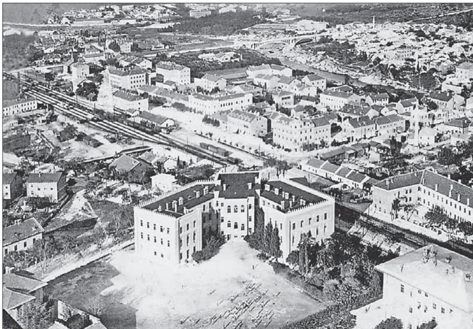
SL. 2. MOSTAR NA POČETKU 20. STOLJEĆA FIG. 2 MOSTAR, EARLY 20 TH CENTURY

Zakon o gradnji i drumovima iz 1863. 8 i Zakon o gradskim općinama iz 1877. godine 9 trebali su uvesti red u područje građenja i komunalne uprave. Oni su djelomično razriješili organizaciju građenja i uveli poziciju grad-