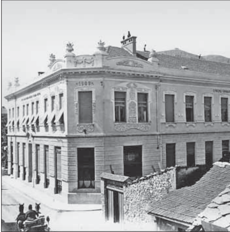
SL. 9. DRUGA SRPSKA OSNOVNA ŠKOLA NA GLAVNOJ ULICI, AUTOR: ĐORĐE KNEŽIĆ

FIG. 9 THE SECOND SERBIAN ELEMENTARY SCHOOL ON MAIN STREET, AUTHOR: ĐORĐE KNEŽIĆ