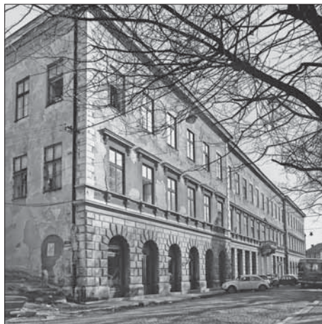
SL. 7. VIŠA DJEVOJAČKA ŠKOLA NA GLAVNOJ ULICI, AUTOR: MILOŠ KOMADINA FIG. 7 GIRLS' HIGH SCHOOL ON MAIN STREET, AUTHOR: MILOŠ KOMADINA