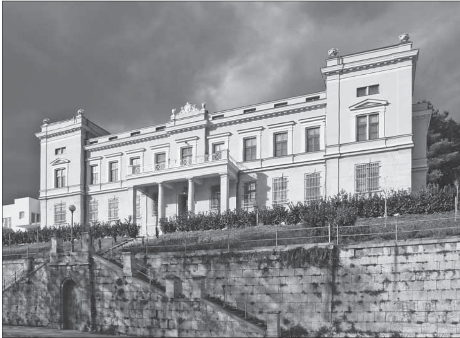
SL. 6. BISKUPSKA PALAČA, AUTOR: MAX DAVID FIG. 6 BISHOP'S PALACE, AUTHOR: MAX DAVID

1880. do 1883. godine. Od 1888. do 1890. radi u Puli. U Mostar dolazi 21. svibnja 1890. i zapošljava se u Okružnoj oblasti u Mostaru gdje radi do 1907. kada prelazi u Tuzlu. Iz njegova bogatog opusa može se izdvojiti zgrada Okružnog suda i zatvor iz 1891. Godine 1894. i 1895. projektira rekonstrukciju Franjevačke crkve u Mostaru s novom propovjedaonicom i bočnim oltarom. Projekt Biskupske rezidencije (Sl. 6.), po kojem je i izvedena, radi 1902. U neoromaničkom slogu 1901.-1902. projektira crkvu Uznesenja Blažene Djevice Marije u Nevesinju te crkve u Stocu 1894. i Širokom Brijegu 1908. 40