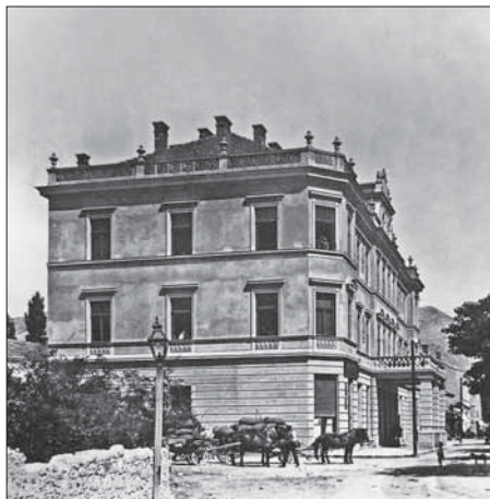
SL. 8. STAMBENA KUĆA MUJAGE KOMADINE U CERNICI, AUTOR: MILOŠ KOMADINA FIG. 8 MUJAGA KOMADINA'S HOUSE IN CERNICA, AUTHOR: MILOŠ KOMADINA

72 AHM GO: K/1 Karte i planovi. Projekt napravljen 1897., a odobren 1899.