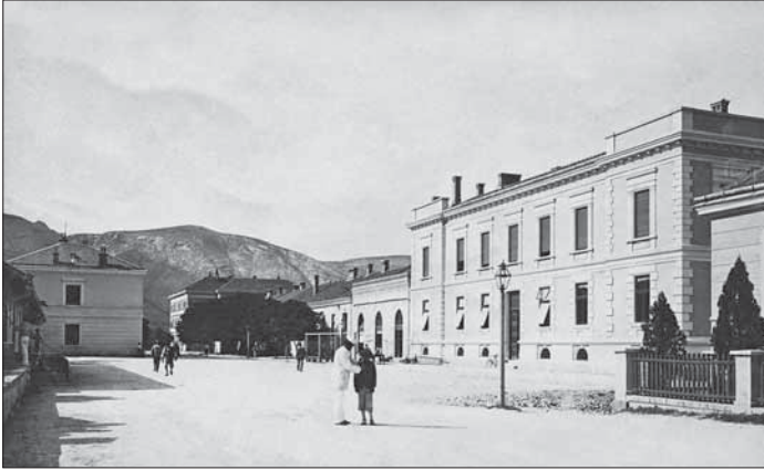
SL. 3. KOLODVORSKI TRG SA ZGRADOM OKRUŽNE OBLASTI I KOLODVORA

FIG. 3 RAILWAY STATION SQUARE WITH THE ADMINISTRATIVE DISTRICT BUILDING AND THE RAILWAY STATION